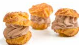
4610 Lionesas de Trufa 42u/c 21g/u *y listo