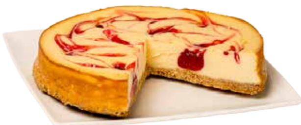
3832 Cheesecake Frambuesa