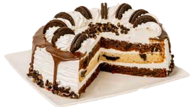
3828 Tarta American cookies