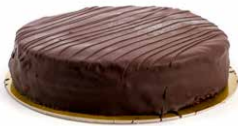
3596 Tarta Sacher Laduc 🍰 1u/c 📦 1Kg ✨ y listo