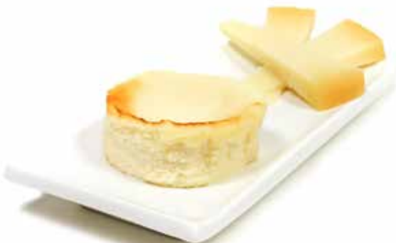
5995 Tarta de Queso Idiazábal 80g €9u/c 8 80g ✱y listo