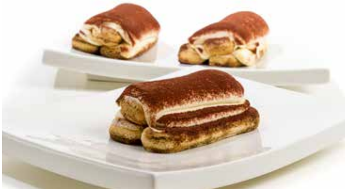
3720 Tiramisú 3 Savoiardis Individual ☞5u/c ☞100g/u ☞y listo