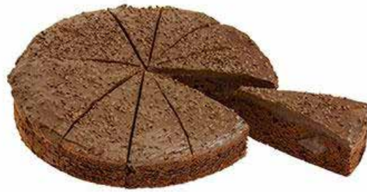
2230 Bizcocho Doble Chocolate 🍰 1u/c 📦 1,4Kg ✨ y listo 🕒 12p