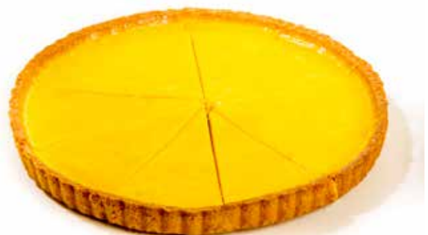
4296 Tarta de limón 🍰 8u/c 📦 750g ✨ y listo 🕒 10p