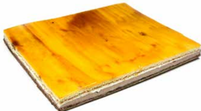
5299 Plancha San Marcos Sin Cortar 1,8Kg