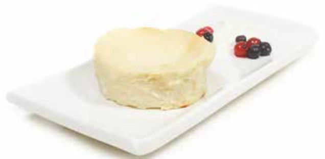
5994 Tarta de Queso Original 80g €9u/c 8 80g ✱y listo