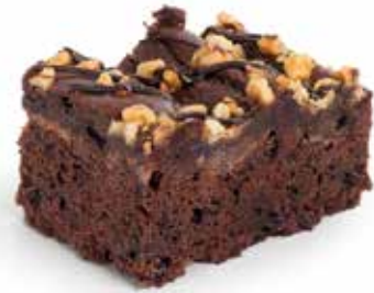
1453 Brownies ☞3x16u/c ☞62,5g/u ☞3x1kg ☞900W 40"