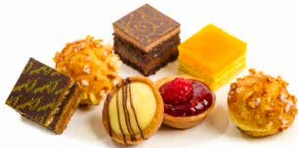
3947 Petit Fours Clasicos ₡38u/c 📦 430g ✨y listo