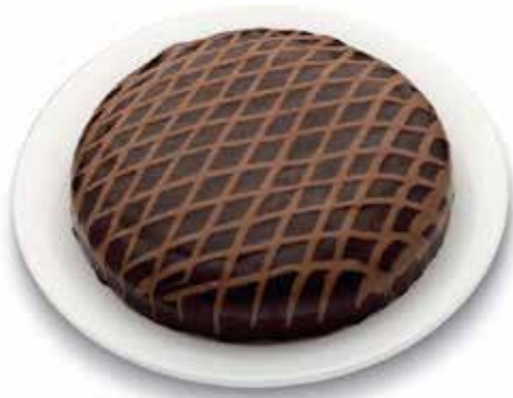
2912 Tarta Doble Chocolate 🍰 1u/c 📦 1Kg ✨ y listo