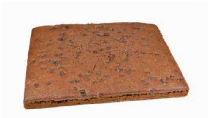
2272 Plancha coca choco con pepitas ☞ 2u/c ☞ 1,8Kg/u ☞ y listo