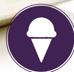
1588 Sorbete en Cesta de Limón ₡24u/c 📦 100g/u Servir congelado