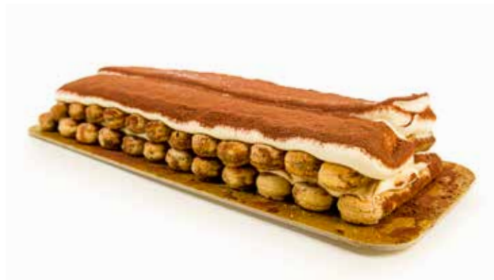
1789 Tiramisú Savoiardí ☞ 1u/c ☞ 1Kg ☞ y listo