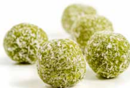
5095 Trufas de Coco y Te Matcha 80u/c 20g/u *y listo