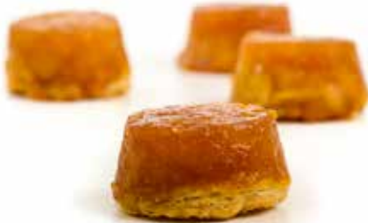
4381 Mini Tarta Tatin ☞48u/c ☞32g/u ☞900W 25"