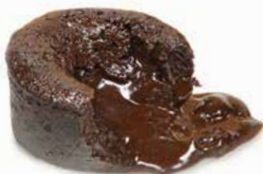
4667 Coulant Fondant Laduc 20u/c 100g/u 900W 45"