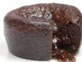
5435 Coulant de Chocolate Sin Gluten 20u/c 90g 900W 40"