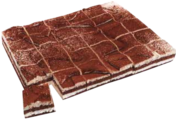
5251 Plancha 30R. Tiramisú 1,8Kg