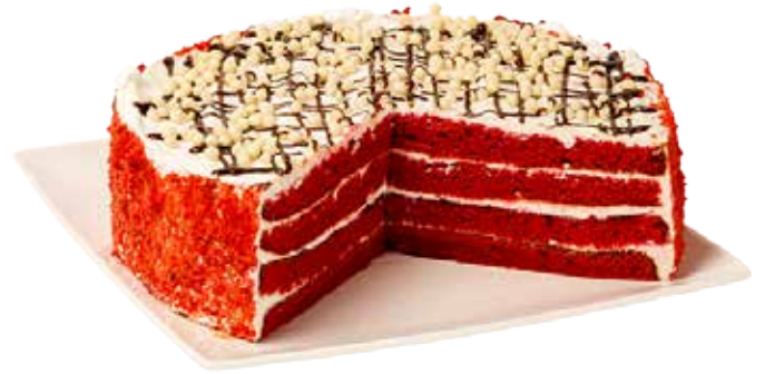
3522 Tarta Red velvet