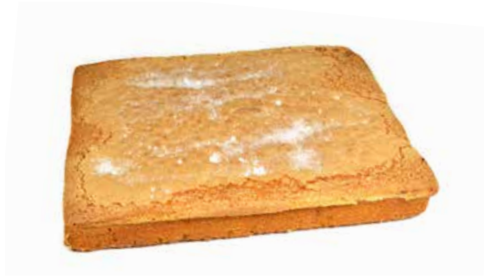
2271 Plancha coca llanda ☞ 2u/c ☞ 1,8Kg/u ☞ y listo