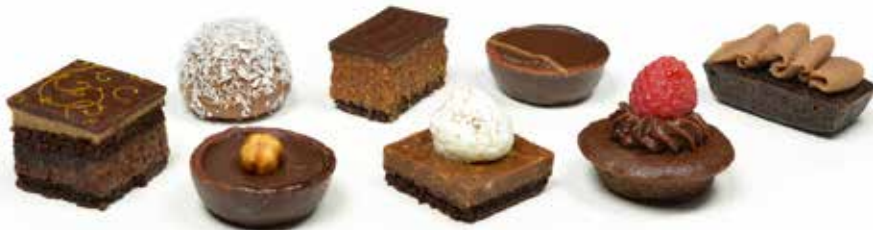
5358 Petit Fours Chocolate ₡42u/c 📦 504g ✨y listo