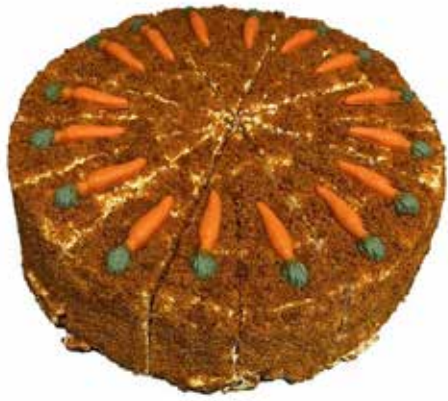
3520 Carrot cake