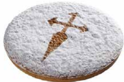
1032 Tarta Santiago 🍰 1u/c 📦 700g ✨ y listo