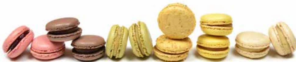
5322 Macarons Classic ☞36u/c ☞12g ☞1,7Kg ☞y listo