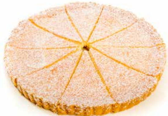
4294 Tarta de Coco 🍰 8u/c 📦 750g ✨ y listo 🕒 10p