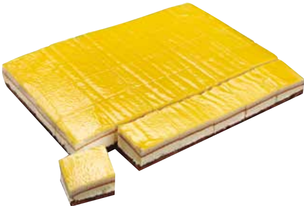
5254 Plancha 30R. Limón 1,8Kg