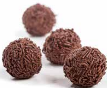
4676 Trufas de Chocolate 50u/c 15g/u *y listo