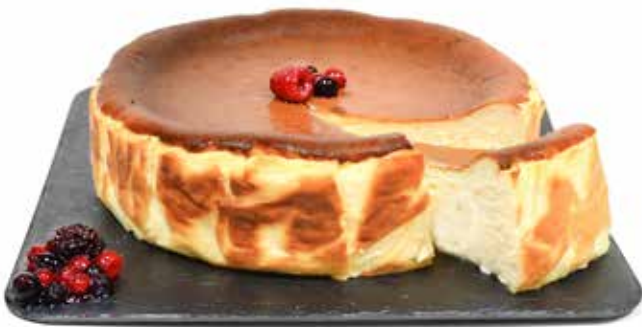
5997 Tarta de Queso Original 1,25kg €1u/c 8 1,25Kg ✱y listo