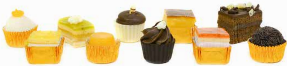
4611 Reposteria Laduc ₡76u/c 📦 1,5Kg ✨y listo