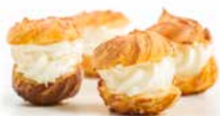
4608 Lionesas de Nata 42u/c 21g/u *y listo