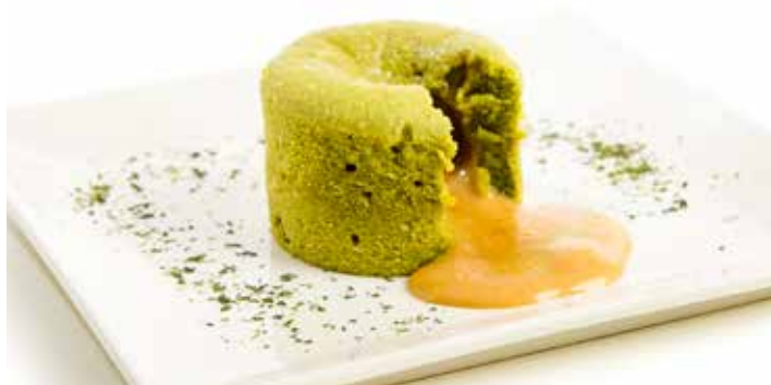
4669 Coulant de Té Matcha y Almendra 20u/c 100g/u 900W 40"