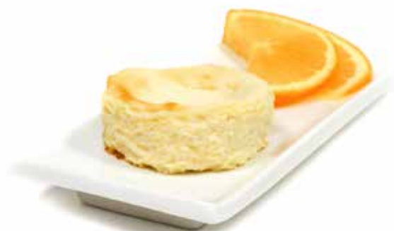
5996 Tarta de Queso Sabor Naranja 80g €9u/c 8 80g ✱y listo