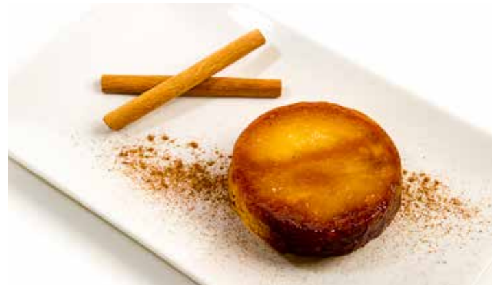
1586 Tarta Tatin ☞18u/c ☞120g/u ☞900W 50"