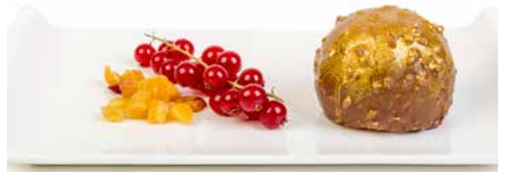
5154 Esfera de Chocolate Dorada 85g ☞20u/c ☞85g/u ☞y listo