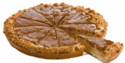
3526 Crumble manzana y caramelo