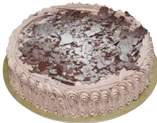
5244 Tarta Selva Negra 1Kg ☞ 1u/c ☞ 1Kg ☞ y listo