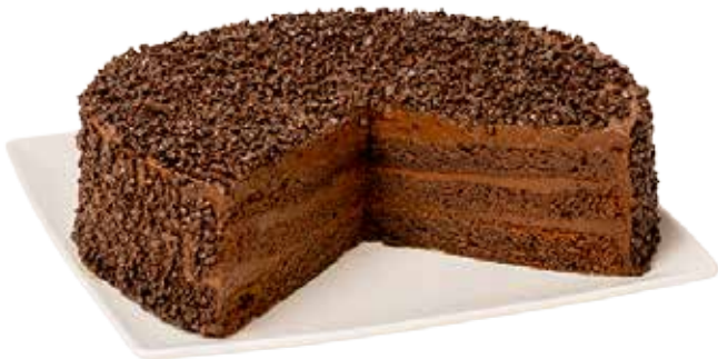
3523 Tarta Muerte por chocolate