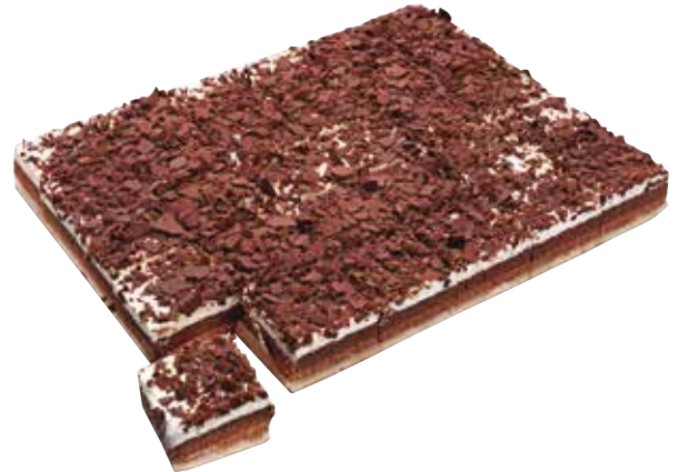
5253 Plancha 30R. Selva Negra 1,8Kg