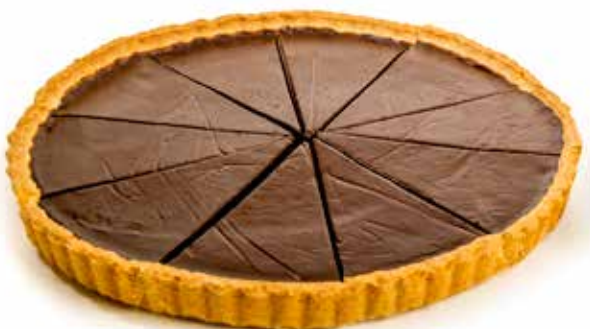
4300 Tarta de chocolate 🍰 8u/c 📦 750g ✨ y listo 🕒 10p