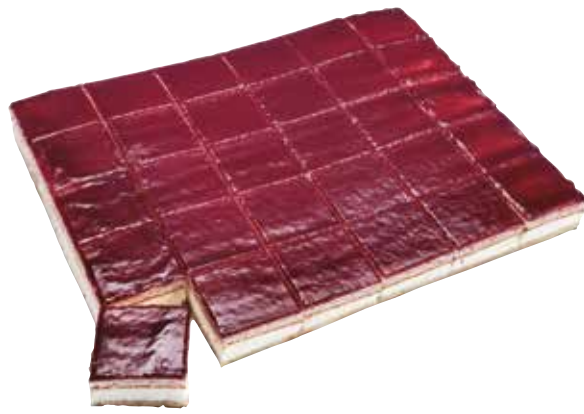
5252 Plancha 30R. Queso/Arandanos 1,8Kg