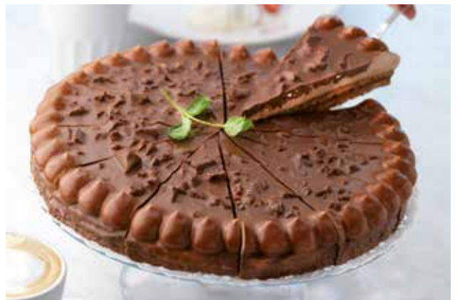
5558 Almond Cake with DAIM® 1kg ☞ 1u/c ☞ 1Kg ✨y listo 🕒 12p