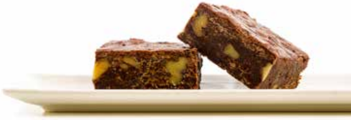
1596 Brownie de chocolate ☞24u/c ☞80g/u ☞900W 40"