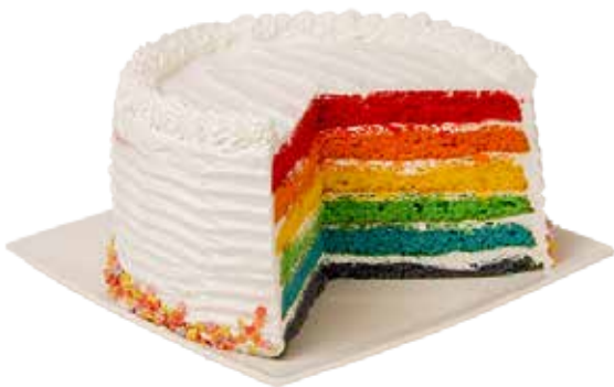
3827 Rainbow cake