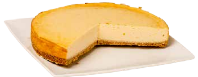
3830 New York Cheesecake