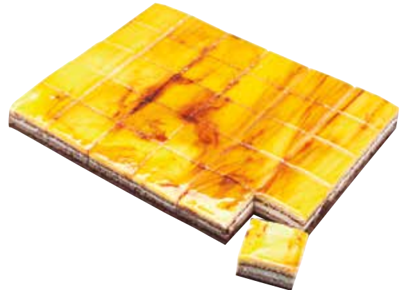
5250 Plancha 30R. San Marcos 1,8Kg