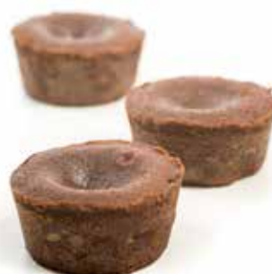
4314 Mini Coulant de Chocolate 80u/c 30g/u 600W 15"